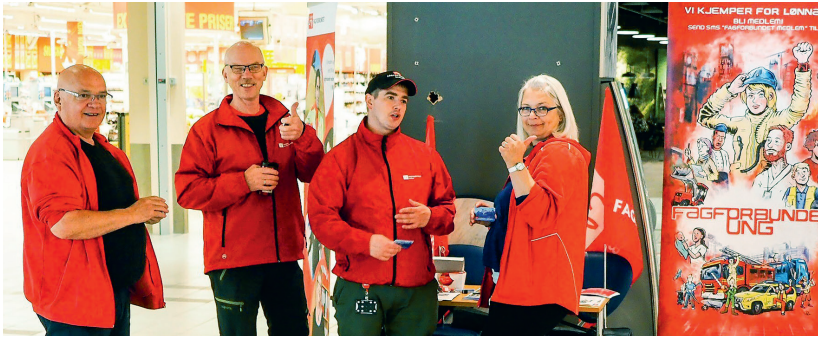
Tillitsvalgte fra Nordland i valgkamp 2019. Her på stand på Svolvær Amfi.

ikke overholdt fordi den borgerlige regjeringen til Erna Solberg ikke ville få fram varige, nye løsninger. Støre-regjeringa har gjenopptatt arbeidet og et resultat er ventet sommeren 2023.