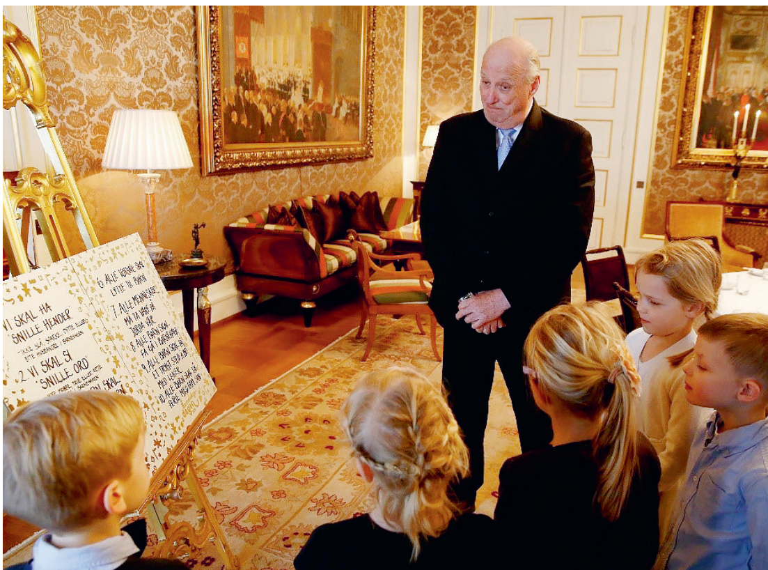
Barna fra Kapellveien viser Kongen sin egen grunnlov.