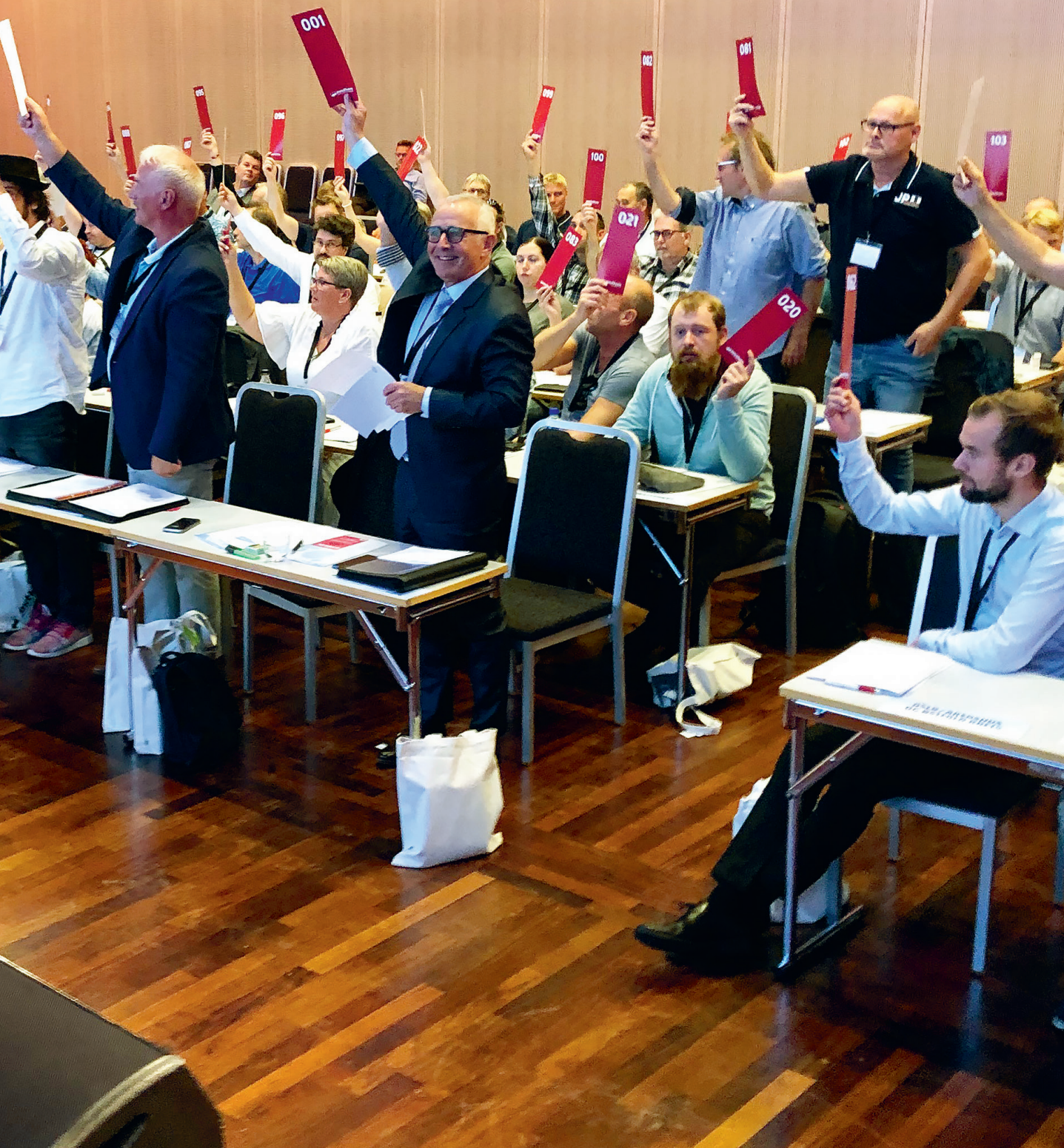
Det ekstraordinære landsmøtet i det som den gang var Poskom stemte for å gå inn i Fagforbundet med stort flertall.