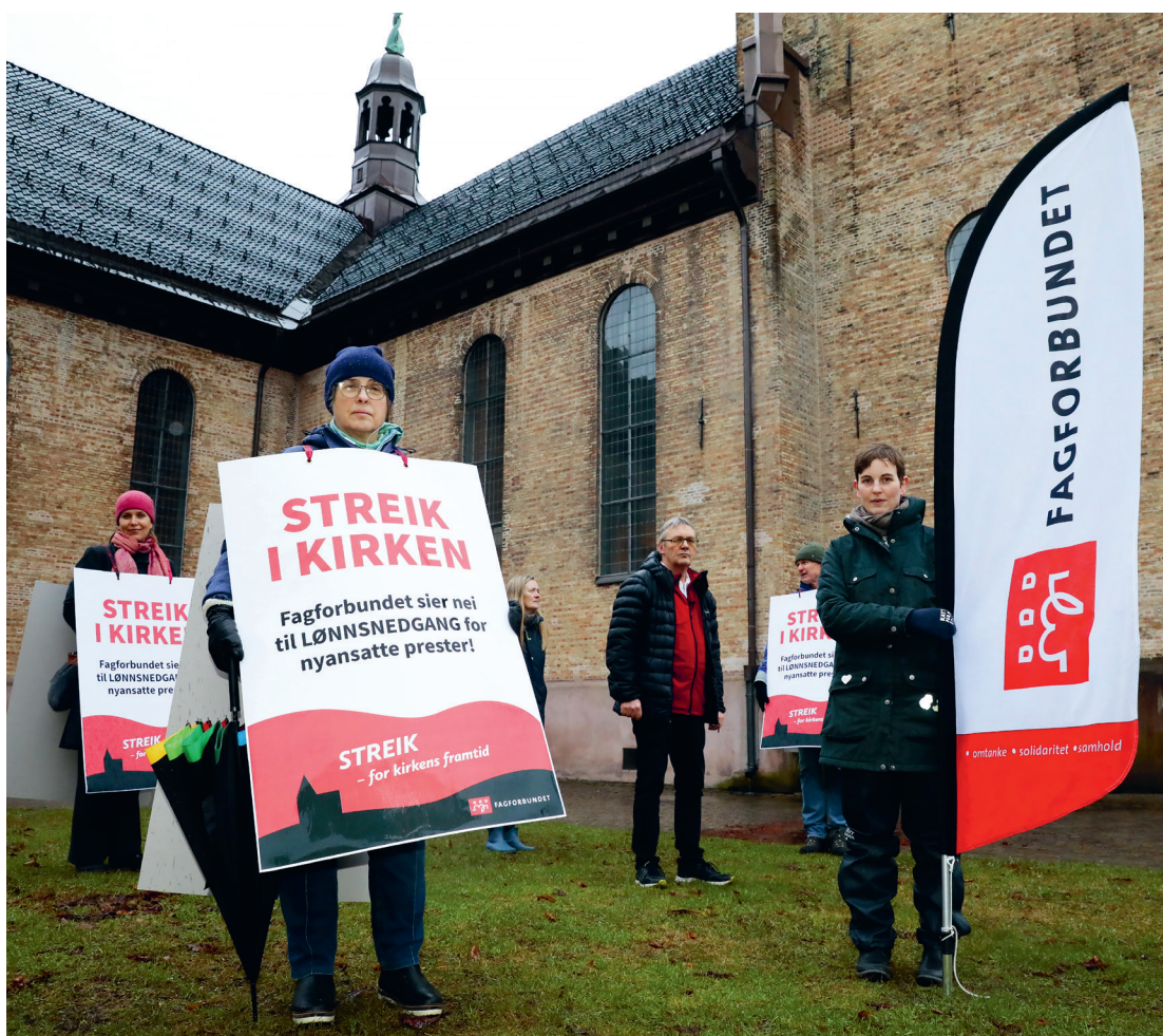
En jul uten gudstjeneste: Prestestreiken vakte internasjonal oppsikt som den første av sitt slag – i hele verden! Bildet er fra en streikemarkering utenfor Domkirken i Oslo i begynnelsen av 2021.

I jubileumsåret 2023 var det for første gang på flere tiår nødvendig med en streik i mellomoppgjøret i selveste frontfaget.